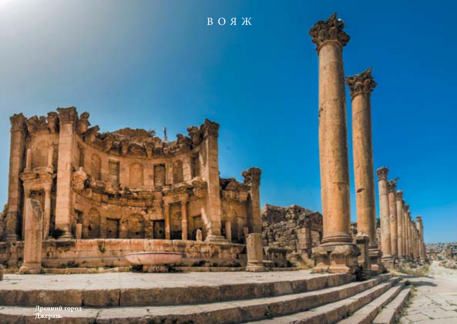
Древний город Джераш.

наследник пророка Мухаммеда, а 25 мая 1946 г. Трансиордания получила независимость. Двумя месяцами позже Абдалла принял титул короля, а страна была переименована в Иорданское Хашимитское королевство. Его столицей стал город Амман. Сегодня Амман – большой и густонаселённый город, в котором проживает почти половина всего населения страны. В Аммане множество отелей категории 4-5 звёзд.