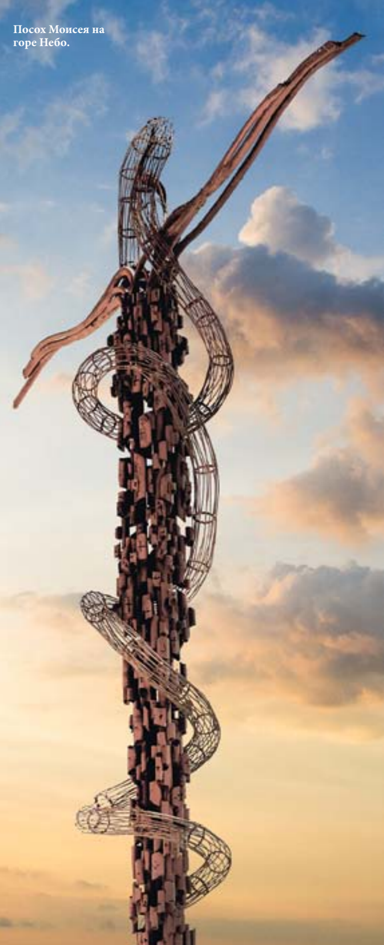
Посох Моисея на горе Небо.

Ещё одно почитаемое место – гора Небо, где, по преданию, был похоронен пророк Моисей. С этой горы открывается живописная картина: долина реки Иордан, Мёртвое море, города Иерихон и Иерусалим. На горе можно посетить мемориальный храм пророка, где пол украшен мозаикой. Перед этим храмом находится так называемый посох Моисея (Змеинный крест).