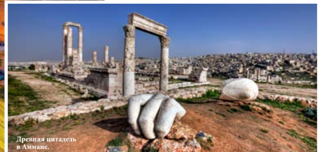
Древняя цитадель в Аммане.

В 1921 г. был образован эмират Трансиордания, который возглавил эмир Абдалла, хашимит и прямой