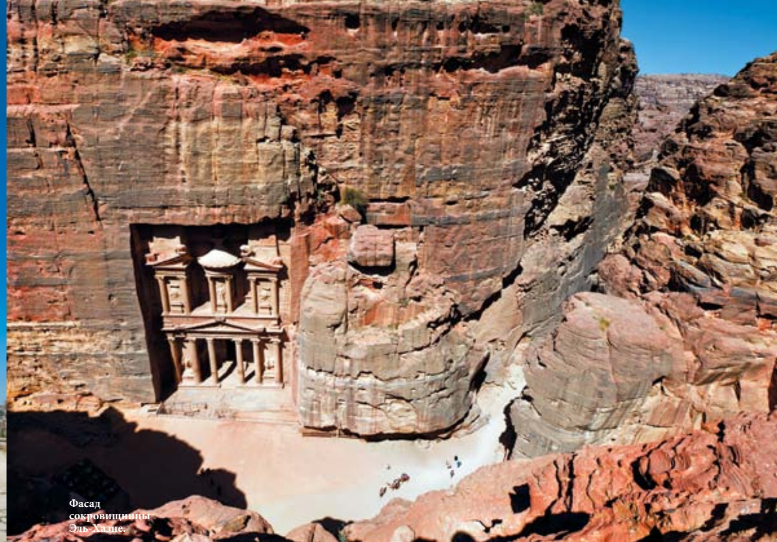
Фасад сокровищницы Эль-Хазне.

Как минимум однодневной экскурсии достоин город Джераш, находящийся примерно в 50 км севернее Аммана. Джераш часто называют самым римским городом за пределами Италии. Расцвет Джераша пришёлся на период римского владычества, в то время город назывался Гераса. Этот древний город прекрасно сохранился, так как многие столетия был погребён под слоем песка и земли. Сход песка был спровоцирован сильнейшим землетрясением 749 г. Исторические раскопки на этом месте начались лишь около 70 лет назад. Сегодня здесь можно увидеть городские ворота Филадельфия, овальную площадь, обрамлённую колоннами,