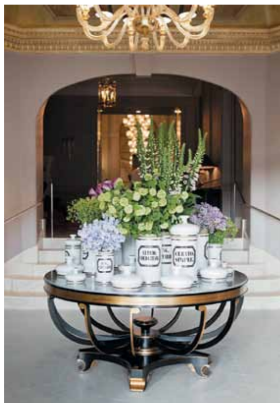
Наверху: фасад отеля d'Angleterre. Внизу: фойе отеля d'Angleterre.

К УСЛУГАМ ГОСТЕЙ D'ANGLETERRE – СПА-ЦЕНТР AMAZING SPACE, ОАЗИС ДЛЯ ОТДЫХА И ОЗДОРОВЛЕНИЯ В ЦЕНТРЕ КОПЕНГАГЕНА. ЗДЕСЬ ЕСТЬ ПОДОГРЕВАЕМЫЙ БАССЕЙН 10x12 МЕТРОВ, САУНА, ХАММАМ, МАССАЖНЫЕ КАБИНЕТЫ.