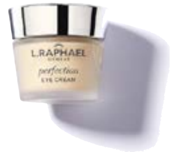
Крем для век Eye Cream Perfection, L.Raphael