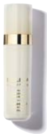
Концентрированная сыворотка против морщин L'Intégral Anti-Age, Sisleya, Sisley