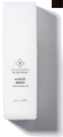
Восстанавливающее масло для лица Roseship Repair, Amazing Space by Laura Bonné