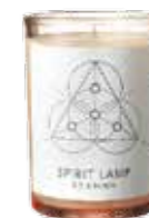
Spirit Lamp, D.S. & DURGA, с нотами кокосового молока и белого имбиря