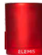
Frangipani Glow Candle, ELEMIS, с аккордами кокоса, иланг-иланга и ванили