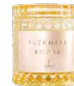
Yuzhnaya Kozha, TONKA, с нотами кожи, шафрана и пачули

ритуалах. Но если процедуры Басти («йогическая клизма») или Широухара (масляный массаж головы) покажутся уж очень экзотическими, можно выбрать более традиционные программы. Например полуторачасовой массаж всего тела Aaamu Theyo Dhemun с миксом масел герань-апельсин. Или Sarawak Massage, основанный на древних индонезийских и малайских техниках. Неожиданным бонусом в конце каждого ухода будет затейливо заплетенная коса (если длина позволяет), украшенная цветком плюмерии, или франжипани, которая растет здесь повсеместно. Воспоминания о Мальдивах вообще очень ольфакторны: о чудо-островах будут напоминать ароматы кокоса, имбиря, папайи и нагретого солнцем дерева.